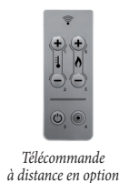
Télécommande à distance en option