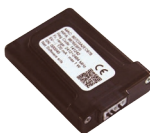
Boîtier Wifi option