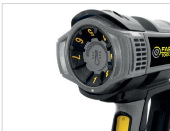
Température ajustable Adjustable temperature