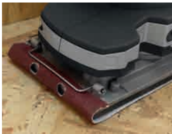
Fixation par pinces Pad grips