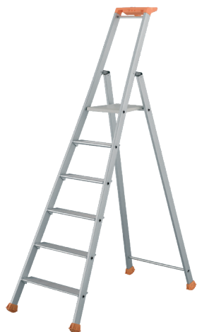
Modèle 6 marches

MP PRO est un marchepied en aluminium anodisé pour un usage ultra-intensif. Il répond à la norme EN 131 et au décret 96 333 et est labellisé NF. Disponible de 3 à 9 marches, il permet d'accéder en toute sécurité à une hauteur maximum de 3,98 m sur un repose-pieds de 280 x 250 mm. Ses sabots enveloppants haute sécurité, ses marches de 90 mm avec système de rotation breveté, sa tablette époxy et ses articulations monobloc font du MP PRO le marchepied par excellence. Il dispose d'un porte-outils avec crochet porte-seau et d'un compartiment refermable pour la visserie. Sa base évasée lui donne une excellente stabilité. Les modèles du 7 au 9 marches ont deux sangles de sécurité.