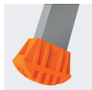
Sabots enveloppants haute sécurité réf. 09007150