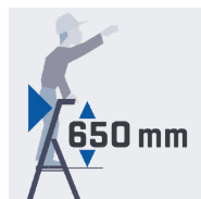
Maxi sécurité anti-basculement avant