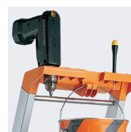
Crochet porte-seau 10 kg MAXI