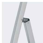
Articulations aluminium montées sur pièce polyamide. Aucun risque de grippage.