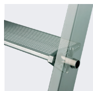
Liaison des montants très résistante.