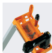
Porte-outils et support perceuse, visseuse...