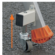
Roulettes autobloquantes escamotables en option