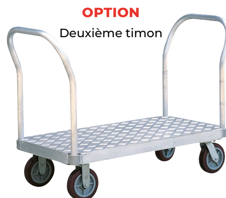
OPTION Deuxième timon