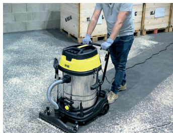
Suceur large : grandes surfaces Wide nozzle : big surfaces