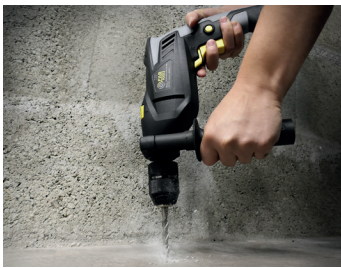
Fonction percussion Impact function

Livrée en mallette avec accessoires Delivered with accessories