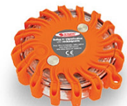
Balise supplémentaire réf.50 02 06