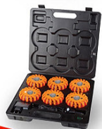
Existe en version mallette 6 balises réf.50 02 05