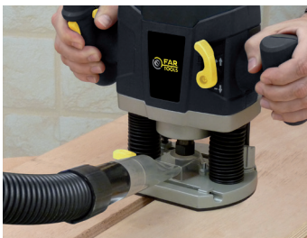
Raccordement à un aspirateur Connection to a vacuum cleaner