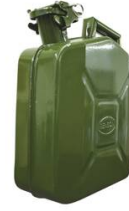
JERRICAN TÔLE HYDROCARBURE 10L