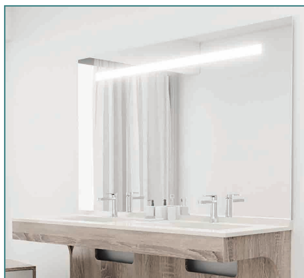
Miroir Elégance GH 140 x 105 cm avec meuble Altéa