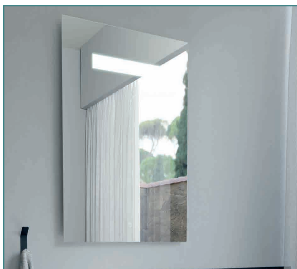
Miroir Elégance 70 x 80 cm