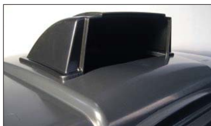
Couvercle spécial papier en option