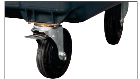
Cages de roues renforcées