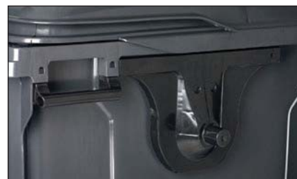
Tourillons plus larges et plus stables