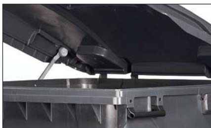
Blocage du couvercle à 30°