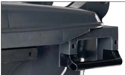
Poignées latérales remplaçables