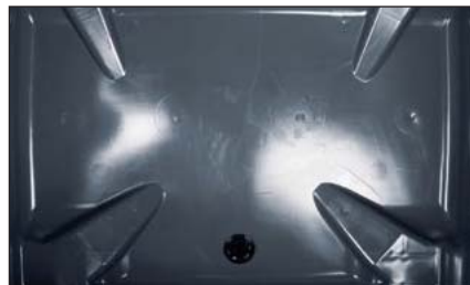
Conception du fond de la cuve conçue par ordinateur