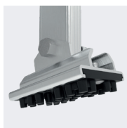
Patins pivotants antidérapants pour s'adapter à toutes les situations