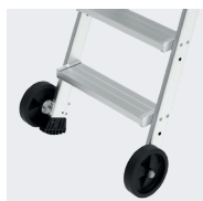
Anneaux de grutage de série