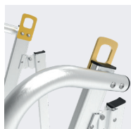
Roues pour faciliter le déplacement