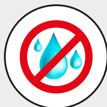
Coupe sans eau Waterless cutting