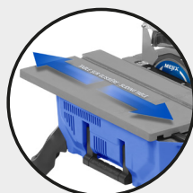
• Table sur glissière Sliding table