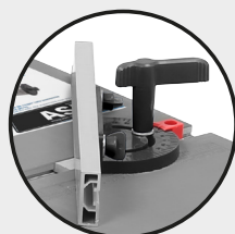
Guide d'angle Angle guide