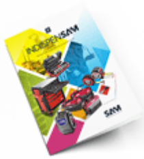
Les outils Indispensables SAM 2021

Découvrez tous nos produits dans nos catalogues en ligne