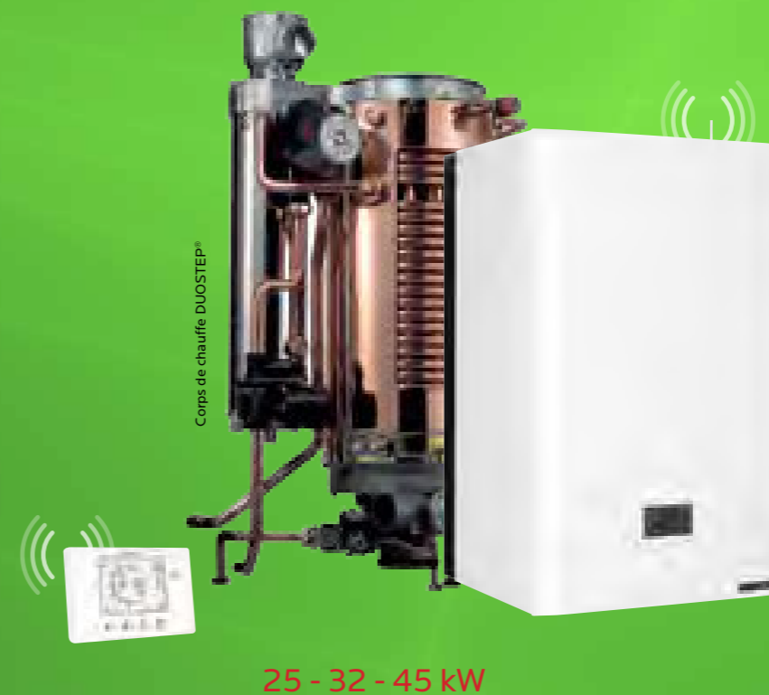
Corps de chauffe DUOSTEP®