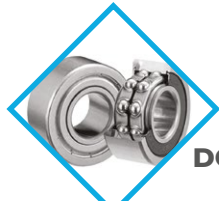
ROULEMENTS À BILLES DOUBLE ÉTANCHÉITÉ