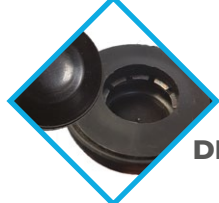
SYSTÈME DE BLOCAGE DE ROUE RENFORCÉ