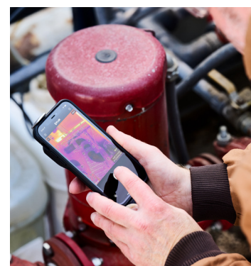
Téléphone portable non inclus

La FLIR ONE Edge Pro est une caméra thermique innovante et robuste qui se connecte sans fil à votre périphérique mobile et vous permet d'inspecter à distance les cibles hors de portée, ou se fixe sur votre téléphone ou tablette pour un fonctionnement d'une seule main. En combinant VividIR™ et FLIR MSX®, vous pouvez prendre des images thermiques nettes depuis n'importe quelle position ou angle avec une prise en main naturelle. La FLIR Ignite™ vous permet de télécharger facilement des images et des vidéos depuis votre FLIR ONE Edge Pro vers le cloud où vous pouvez modifier, organiser, stocker et partager des données. Compatible avec les smartphones et tablettes iOS et Android, la FLIR ONE Edge Pro peut être utilisée sans limites, quels que soient l'opérateur, le système d'exploitation, la taille ou les futures mises à niveau des périphériques mobiles.