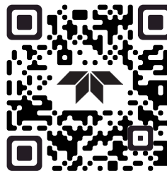
Applications FLIR de l'Apple Store