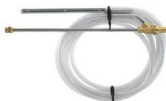
KIT DE SABLAGE DIAMETRE 050 MALE EURO