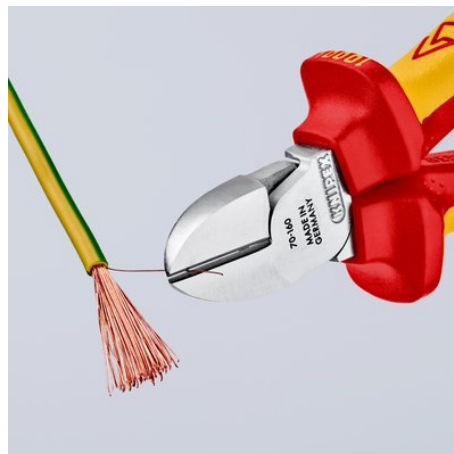
coupe nette des fils en cuivre fins, même en bout de tranchants