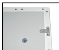
Livré avec 1 crochet de fixation pour filin de sécurité