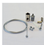
Livré avec 1 filin de sécurité