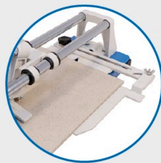
● Équerre. Square ruler.