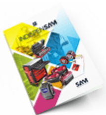
Les outils Indispensables SAM 2021

Découvrez tous nos produits dans nos catalogues en ligne