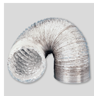
GSA-M0 100 Conduit flexible aluminium.