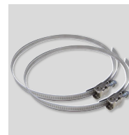
CX-80/125 Colliers de serrage.