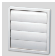
PER-100W Volet de surpression.