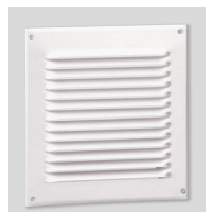
GRA-75 Grille extérieure aluminium.