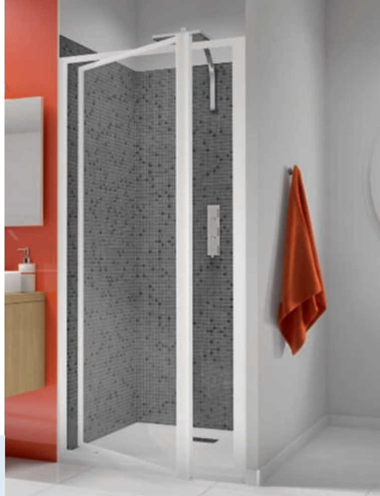
Supra II P - profilé blanc - verre transparent