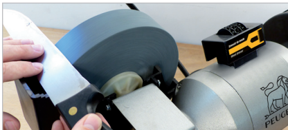
Meule à eau ∅ 200 mm Grain A80 Wet grinding wheel ∅ 200 mm grit A80