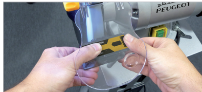
Dressoir incorporé pour rectifier les meules après affûtage Built-in dresser for grinding wheels for sharpening