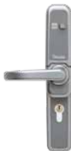
Garniture mécanique 1210A à code , pêne demi-tour, avec volet de protection, main A.