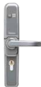
Garniture mécanique 1210B à code , pêne demi-tour, avec volet de protection, main B.