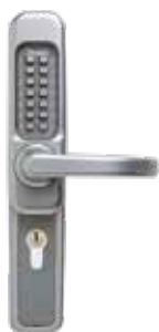
Garniture mécanique 1200B à code , pêne demi-tour, main B.