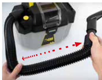
Tube extensible Stretch hose