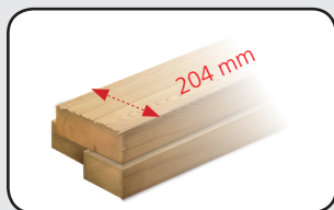
Idéal pour les bastingas Ideal for the bastingas