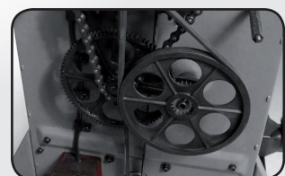
Système d'entraînement par courroie Belt driven system