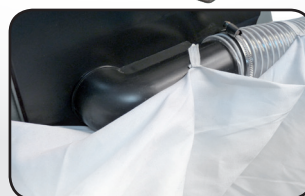
Sac de récupération des copeaux Dust collection bag