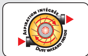
Système d'aspiration intégré Dust wizard inside