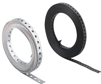
Bande perforée LBV / LBK