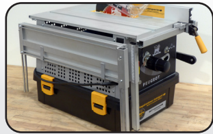
Stockage des extensions de table 580x400x410 mm (Lxlxh) Table extensions storage