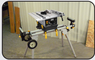
S'adapte sur support de scie Fit on miter saw stand