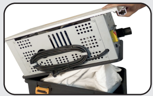
Aspirateur intégré Built in vacuum cleaner