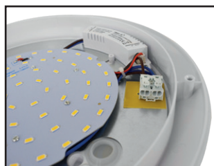
Connecteur rapide double entrée