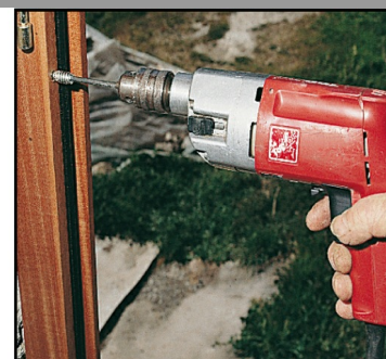
4. Visser et c'est fini !