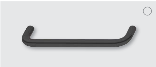
Acier inox, qualité 1.4301, noir graphite, revêtement PVD

Dimensions 106 x 35, ea 96 mm Réf. 112.04.070 Dimensions 138 x 35, ea 128 mm Réf. 112.04.071