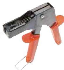
PA - Pince pour cheville HM