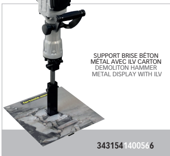
SUPPORT BRISE BÉTON MÉTAL AVEC ILV CARTON DEMOLITION HAMMER METAL DISPLAY WITH ILV

«Puissant, bonne prise en main et relativement silencieux.» Aurélien D.