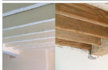
Idéal projets de restauration Ideal for restoration projects