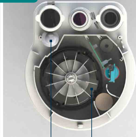
Dispositif ultra performant à clapet d'évent évitant la remontée de mousse