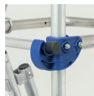
Ceinture de sécurité rigide à 360°