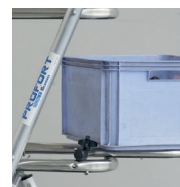
2 positions possibles pour la tablette porte-outils en option