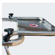
Tablette porte-outils en option Réf. 02272526