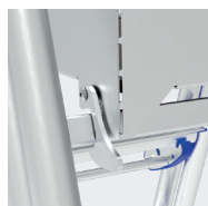
Verrou anti-soulèvement de la plate-forme

Livré sous emballage plastique rétractable. La plate-forme est comptée comme une marche.