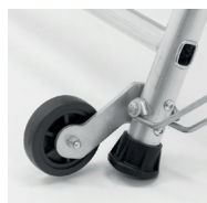
2 roulettes Ø 100 mm pour les déplacements