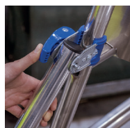
Système de blocage des stabilisateurs par Ergoblock®