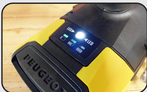
Éclairage LED de la zone de travail LED light of the working area