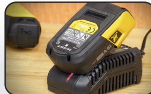
Chargeur rapide : temps de charge 45 min Fast charger : charging time 45 min