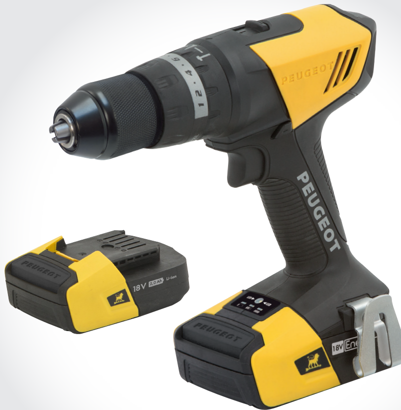
Livrée avec chargeur Charger included

DESIGNED IN FRANCE BY PEUGEOT DESIGN LAB