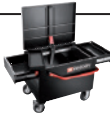
SERVANTE COFFRE 2092BPB