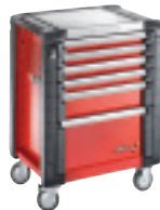
SERVANTE JET+ JET.6M3PB