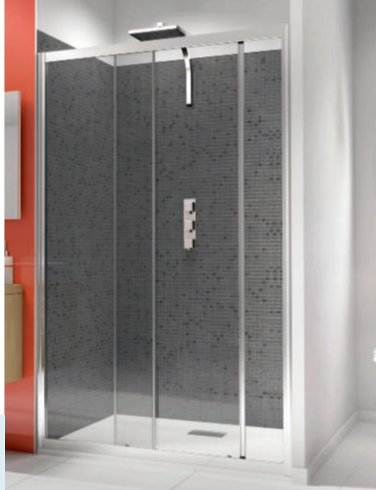
Supra II C - profilé chromé - verre transparent