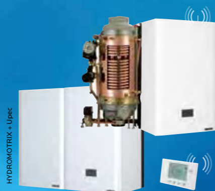
Hydromotrix 25 - 30 kW