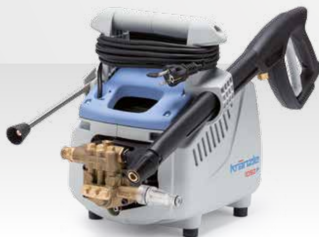
K 1050 P (modèle portable)