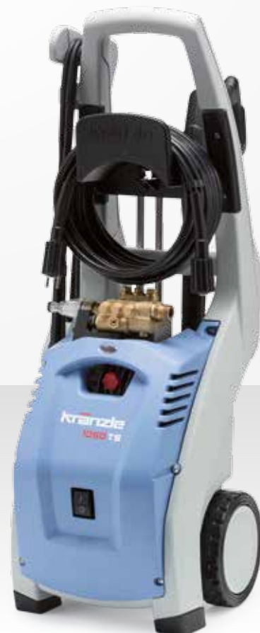
K 1050 TS (modèle sans tambour-enrouleur)