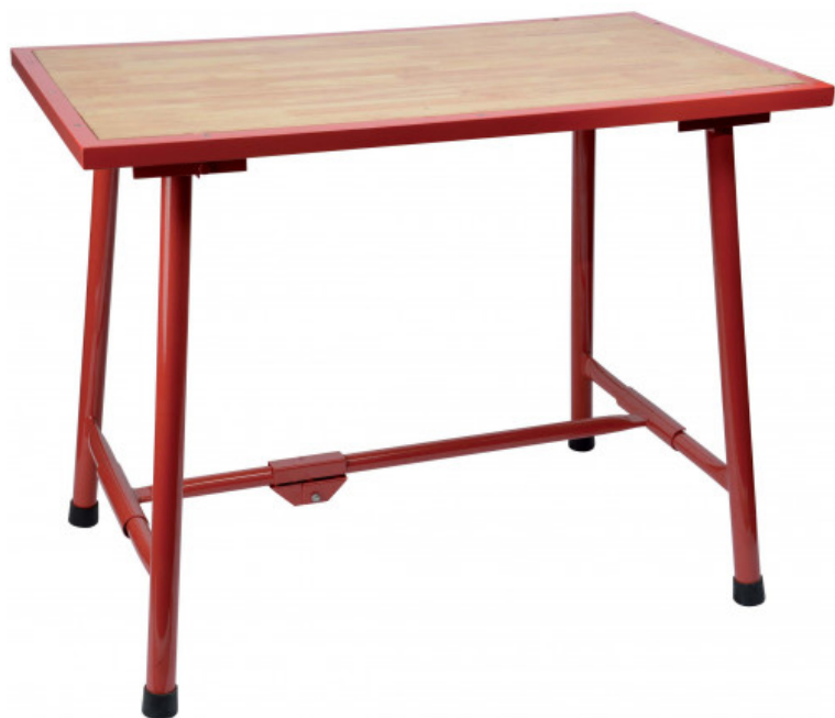
Table pliante pour plombier