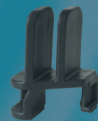
Bague de blocage du flotteur fournie.