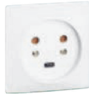
0 554 22

Référence(s) : 0 554 22/25/27/32/52/55/57 - 0 901 34/36/38 0 551 52/55/57 - 0 901 14/16/18 0 554 39 - 0 558 49