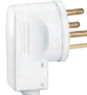
0 551 55