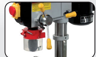
Commandes droitier ou gaucher Right or left hand system