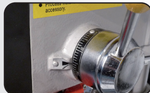
Butée de profondeur Depth gauge