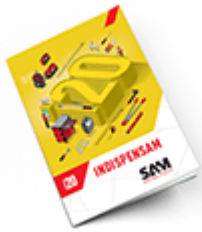
Les outils Indispensables SAM 2020