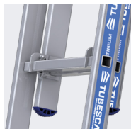
Les deux plans d'échelles sont indissociables. Modèles 02422712