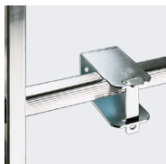
Support anti-vol mural pour échelle Ø10 mm. Réf: 09060000