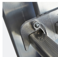
Verrouillage du plan coulissant