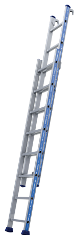
Modèle 2 x 8 échelons

L'échelle Platinum coulisse à main 2 plans à crochets à fixer permet d'accéder à 6,95 mètres de hauteur travail. Elle est composée de 2 plans et est entièrement conçue en aluminium. Ses crochets en fonderie d'aluminium permettent un amarrage sur tout type de support. Elle répond au décret 96 333.